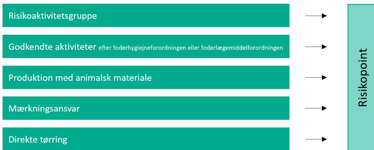
Figur 2 Oversigt over risikoplysningernes overordnede inddeling

Den aktivitetsbaserede risikokarakterisering af den enkelte fodervirksomhed sker på baggrund af risikoplysninger, som er inddelt i de 5 kategorier vist i grønne kasser i Figur 2 herunder. Hver risikoplysning giver et antal risikopoint, og alle risikopoint for det enkelte kontrolobjekt summeres. I kapitel 13.7, 0, 13.9, 13.10 og 13.11 bliver de fem kategorier gennemgået. Nogle risikoplysninger lægger risikopoint til et kontrolobjekts sum, andre trækker risikopoint fra. Risikoplysninger, der trækker fra er aktiviteter og produkter, som kun udgør en lille risiko for fodersikkerheden.